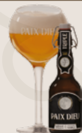
3 Paix Dieu 10,0%