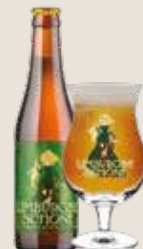
3 Limburgse Schone 7,2%