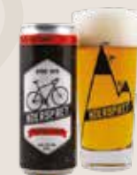
3 Koerspret 7,5%