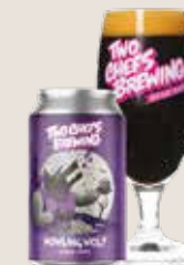
5 Two Chefs Howling Wolf 8,0%