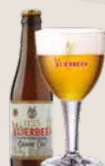
3 Vlierbeek Grand Cru 8,5%