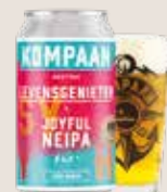
6 Kompaan Levensgenieter 4,5%