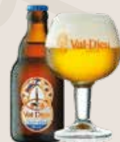
3 Val-Dieu Blonde 6,0%