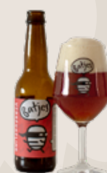
3 6 Batjes Verrèkkeling 8,0%