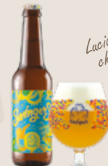
2 Oedipus Swingers 4,0%