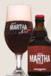
2 Martha Guilty Pleasure 8,0%