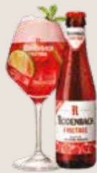
2 Rodenbach Fruitage 3,9%