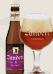
5 Zundert 10,0%