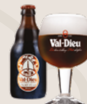
5 Val-Dieu Brune 8,0%