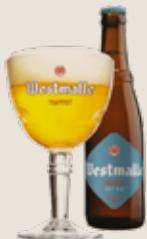
1 Westmalle Extra 4,8%