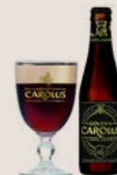
6 Gouden Carolus Whisky Infused 11,7%