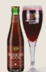
6 Boon Framboise 5,0%