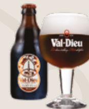
5 Val-Dieu Brune 8,0%