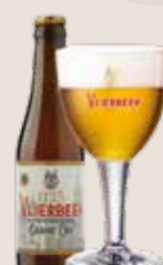
3 Vlierbeek Grand Cru 8,5%