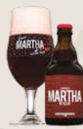
2 Martha Guilty Pleasure 8,0%