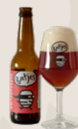
3 6 Batjes Verrèkkeling 8,0%