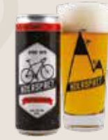
3 Koerspret 7,5%