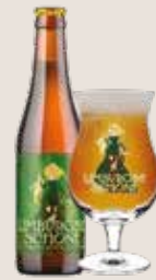
3 Limburgse Schone 7,2%