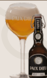
3 Paix Dieu 10,0%