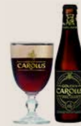
6 Gouden Carolus Whisky Infused 11,7%